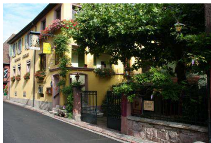
村で唯一のプチ・ホテル「アンジェ」 (ニーデルモンシュヴィル)

旅行期間： 2013年10月14日(月)～10月20日(日) 旅行料金：362,000円